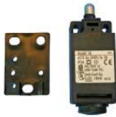
Netzteil IP 67

Prim.: 100-240V 50/60Hz Sec. : 24V DC barrel connector 2,5mm